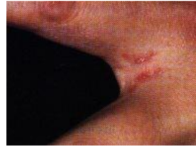
ฝิ่นที่ซอกนิ้ว

ตำแหน่งที่ติดเชื้อบ่อยคือ ซอกนิ้วมือนิ้วเท้า หัวหน้า ขาหนีบ ข้อมือ เต้านม อวัยวะ ท้อง ส่วนบริเวณที่พบน้อยได้แก่ฝ่ามือฝ่าเท้า