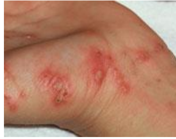
ผื่นที่มือ มีรอยแนวเคลื่อนที่